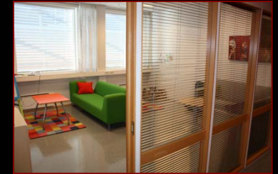
Barnehuset i Tromsøs vente- og lekerom