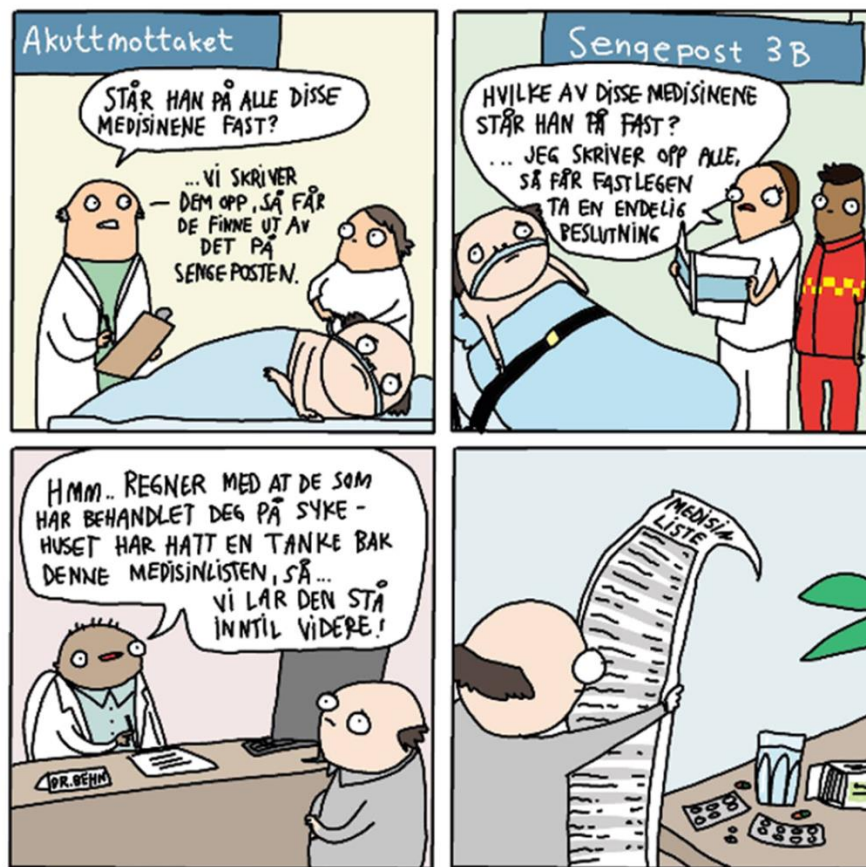
Illustrasjon: Hanne Sigbjørnsen

Fagkonferanse 3. oktober 2017 Kurskvelder 11. og 18. oktober 2017 i Tromsø